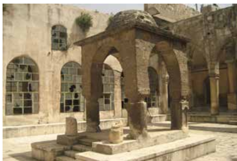
הריסות בית הכנסת העתיק של חלב לאחר הפרעות בשנת 1947