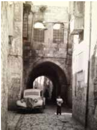
רחוב בעיר חלב

"יצאתי לרחוב הסואן, מבוהלת מכל השריפות מסביב" מוסיפה אימי